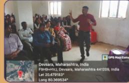
अपनी व्यवस्थापन कार्यदर्शन मार्यदर्शन करताना मा. भोरे, वी.एच.अण्ण. चोतिरा म्हाणे केंद्र, मालेवाडा मार्यदर्शन सारंग दीपण महाविद्यालयीन प्राध्यपक, शिक्षक संघटनेचे व विद्यार्थी.