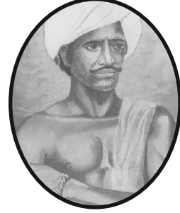
भगवान बिरसा मुंडा